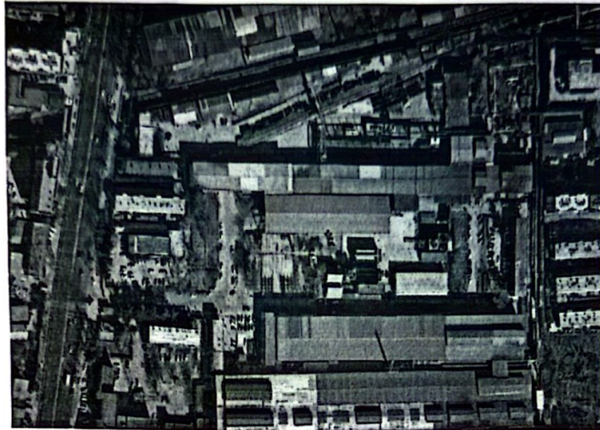
图五需处置的建构筑物

2. 处置资产说明：包含软水泵房、东大门值班室、生产准备仓库、加热炉风机房及钢制烟囱、水井泵房、西区车棚、厂区煤气管道（标识位置至加热炉段）等。