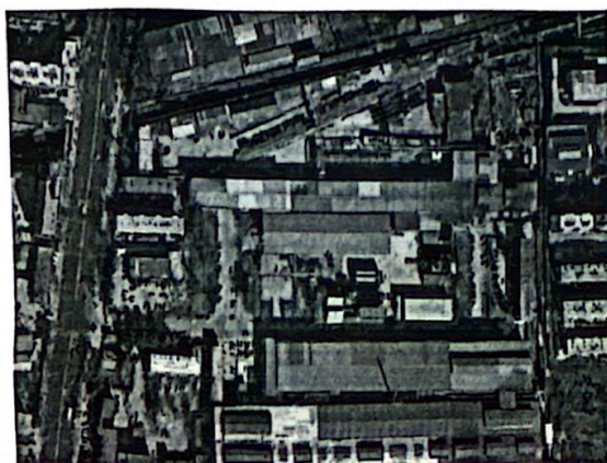
图二 小轧配电室处置区域

1. 红线区域非处置资产：小轧配电室房屋建筑物、10KV 高压配电柜、标识为非处置的设备设施不属于处置资产，拆除时需做好防护。