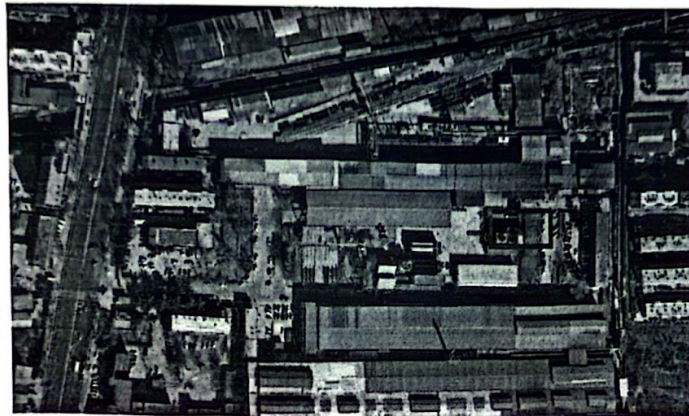
图三 水处理处置区域

2. 处置资产说明：水处理设备拆除，包含穿水装置及电控系统、自吸泵、清水泵、潜水电泵、玻璃钢冷却塔、水管道（以切断标识为界，连接至设备的管道为处置资产）以及基础平台。