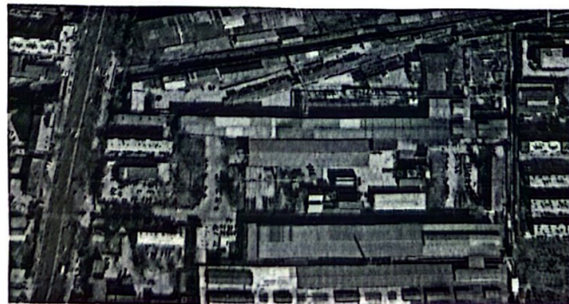
图四 机加工处置区域

1. 红线区域非处置资产：机加工厂房、行车及标识为非处置的设备设施均不在此次拆除处置范围内。